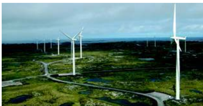
Smøla Wind Farm in Møre og Romsdal.

The Smøla Wind Farm is located on the island of Smøla in Møre og Romsdal. The wind farm is located in flat, open terrain 10–40 metres above sea level, and the wind turbines are located on ridges in the terrain. With a total of 68 wind turbines, Smøla Wind Farm is Europe's largest land-based wind farm with an annual power production of 450 GWh. This corresponds to the average consumption of 22,500 Norwegian households.