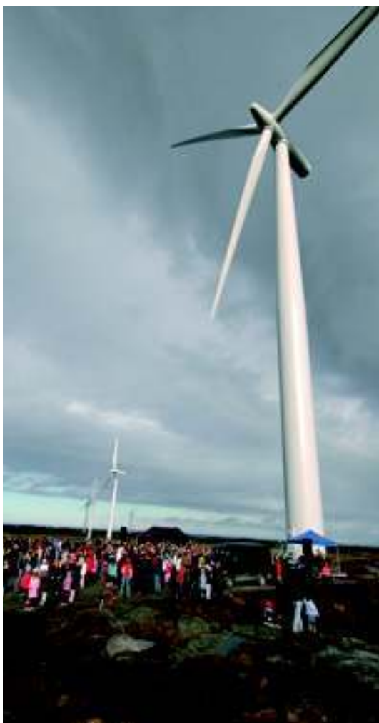
Official opening of Smøla 2 27 September 2005.