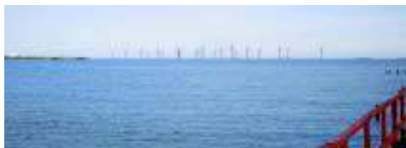
Figure 2 The Middelgrunden “the three rows” and “the curved line” from the beach at Kastrup [11]